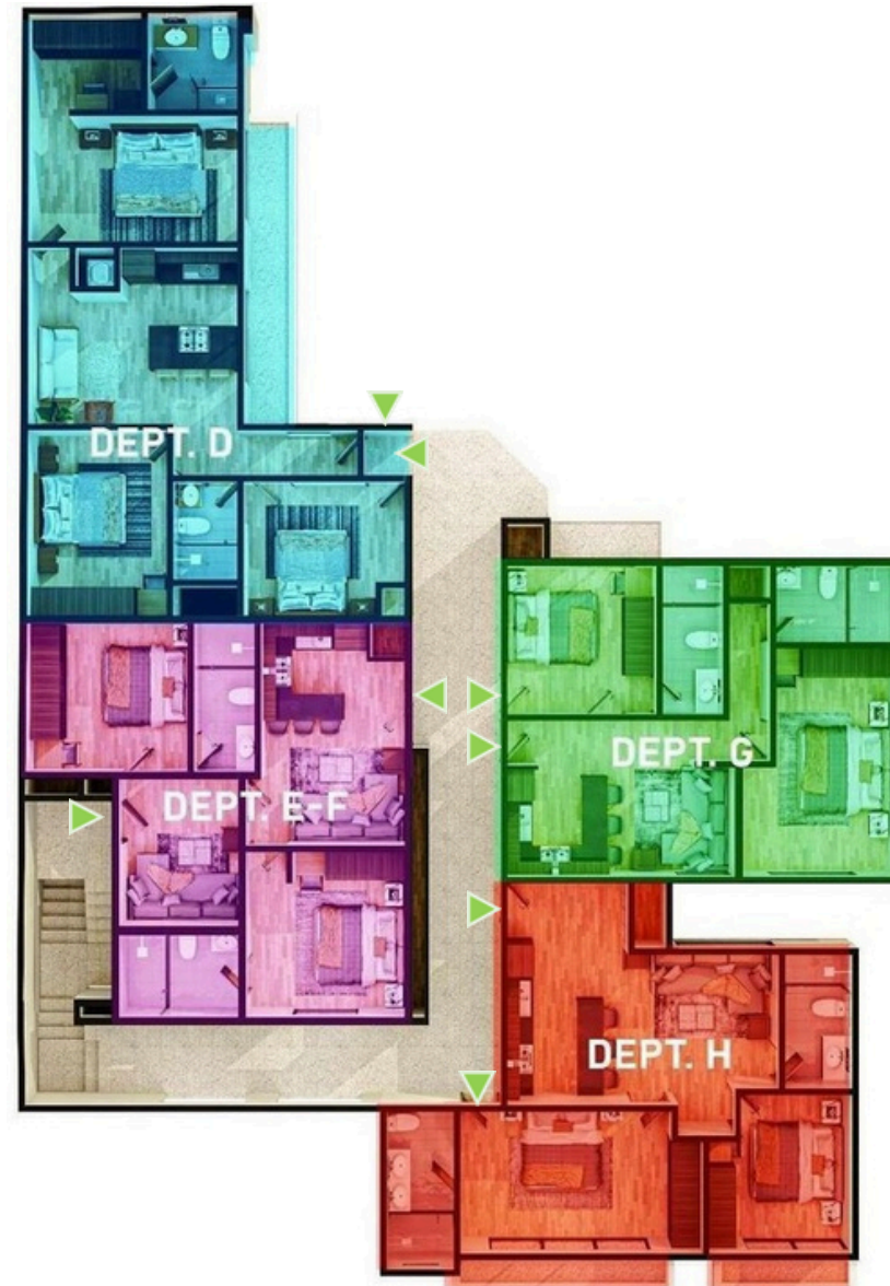
PLANTA NIVEL 1