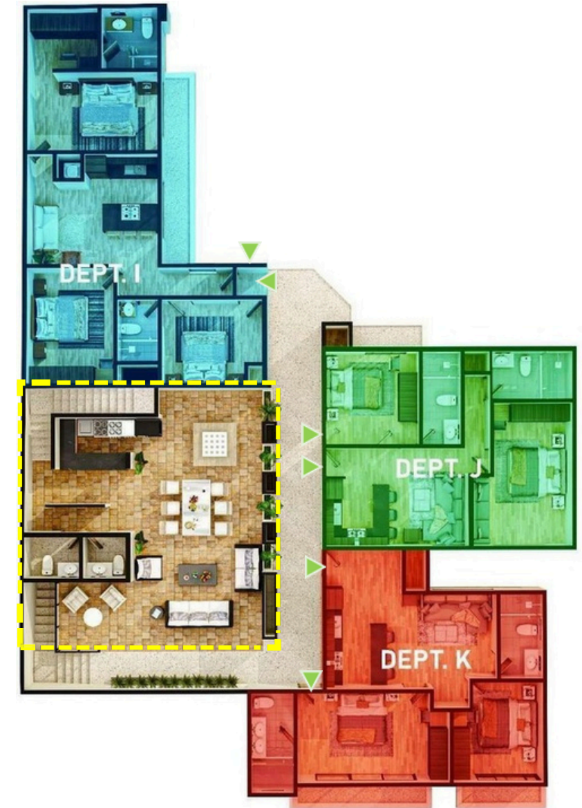
PLANTA NIVEL 2